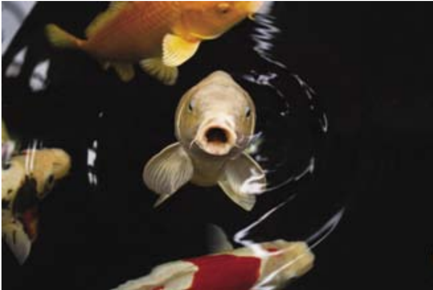
Et stor bassin med karper hører med til de rekreative oaser i kulturhuset, hvor man også midt i fællesskabet kan finde en krog og være privat, hvis det er det, man ønsker.

egne handleplaner. Her gælder det om at skabe symmetri i handleplanen. At finde ud af, hvordan vi behandler borgerens ønsker? Hvordan vi afdækker perspektiverne?