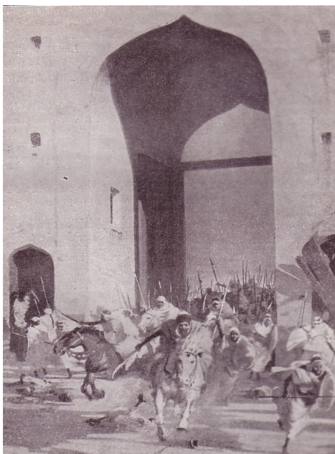
Muhamedanere stormer gennem fæstningsværkerne til byen Laodicea i 636. De moderate er underrepræsenteret på billedet, der er malet af W. S. Bagdatopulos.

moderate og tolerante muhamedanere er den pakistanske journalist Rushy Rashid Højbjerg, som i Berlingske