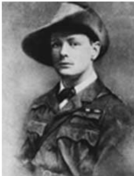
Winston Churchill under boerkrigen

"Hvor forskrækkelige er ikke de forbandelser, muhamedanismen pålægger sine tilhængere! Ud over den fanatiske galsskab, der er lige så farlig i en mand som hundegalskab i en hund, er der denne frygtsomme, fatalistiske sløvhed. Virkningerne er åbenlyse i mange lande. Ubetænksomme vaner, sjuskede landbrugssystemer, dorske handelsmetoder og usikkerhed omkring ejendom eksisterer overalt, hvor profetens tilhængere regerer eller lever. En forgrovet sanselighed fratager livet al den ynde og forædning, der ligger op ad dets værdighed og renhed. Den kendsgerning, at enhver kvinde efter muhamedansk lov skal tilhøre en eller anden mand som dennes ejendom - enten som barn, hustru eller elskerinde - vil forhale slaveriets endelige uddøen, indtil islams tro hører op