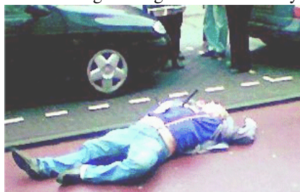
Filmskaber Theo van Gogh - halal-slagt på åben gade i Amsterdam.

De sidste få års stadig skarpere markeringer fra muslimerne af noget ganske andet og nu senest mordet på Van Gogh har for mange menige hollændere bety-