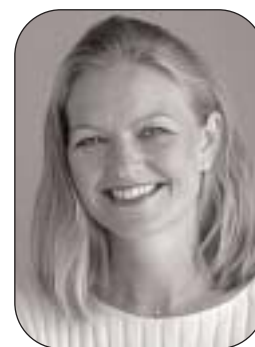
Eva Kjer Hansen Social- og Ligestillingsminister

Jeg går ind i arbejdet med stor energi, og jeg glæder mig meget til samarbejdet med alle de frivillige organisationer, som jeg synes, gør en god indsats for ligestillingen.