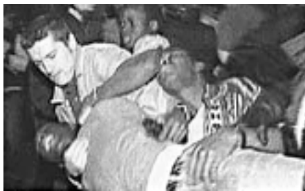
Fransk politi deporterer afrikanere - den eneste løsning.

Løsningen kan kun være tvangsmæssig udsendelse. For yderligere at bremse tilstrømningen antydes en fremgangsmåde ved, at den algeriske regering i 1973 standsede udvandring til Frankrig efter nogle “racistiske attentater” dér.