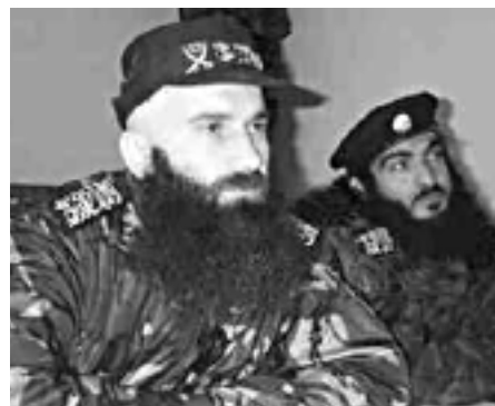
Tjetjenske mujahediner

Muslimerne i Tjetjenien ønsker selv med disse bånd at vise verden, hvad de står for. Lad os dog hjælpe dem lidt på vej! Den Danske Forening har kopieret dette bånd, så enhver der ønsker det kan få et eksemplar.