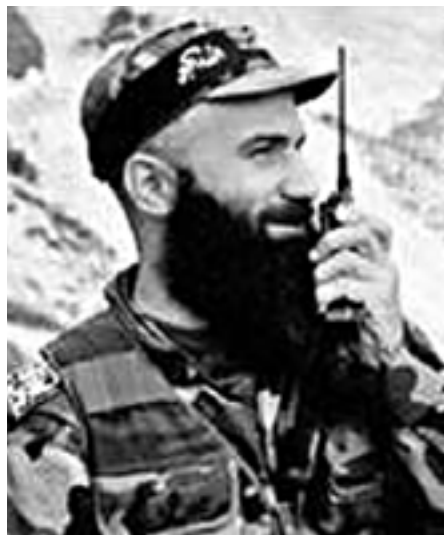
De tjetjenske mujahediners leder Shamil Basajev

Anderledes er det gået for de hundredvis af russere og prorussiske randstatsborgere, som muslimerne har fået fat i, idet disse staklers pårørende ikke har haft nogen chance for at udrede de beløb, som muslimerne kræver for at løslade de gidseltagede personer.