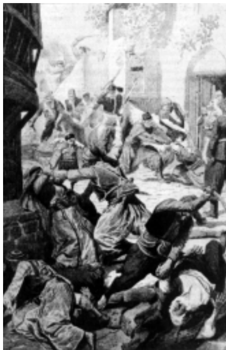
Tyrkisk massakre på armeniere afbildet i "Le Petit Journal" 12/12 1916