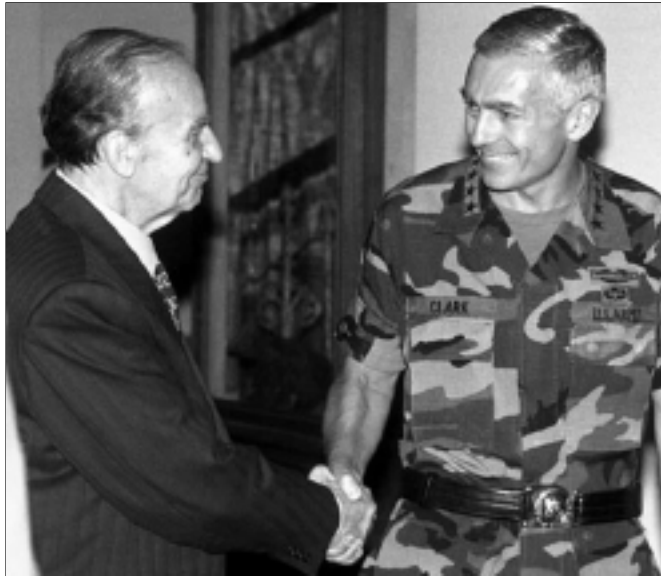
Izetbegovic hilser på en medsamsvoren, general Wesley Clark