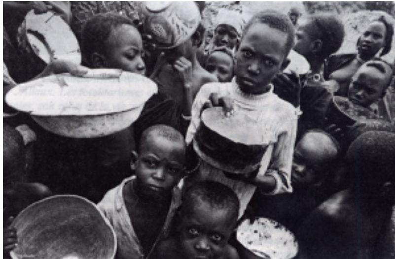
Radikal u-landshjælp: Send "sultens slavehær" til Europa!!