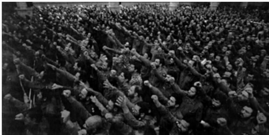
Allahs helligkrigere vil dræbe flest muligt vantro.

Den vigtigste pligt for enhver muhamedaner er, når mulighed gives for at dræbe flest mulige kristne, jøder og andre vantro. Det har jeg ophobet beviser for i de dokumentationer, jeg har fremført. Heraf