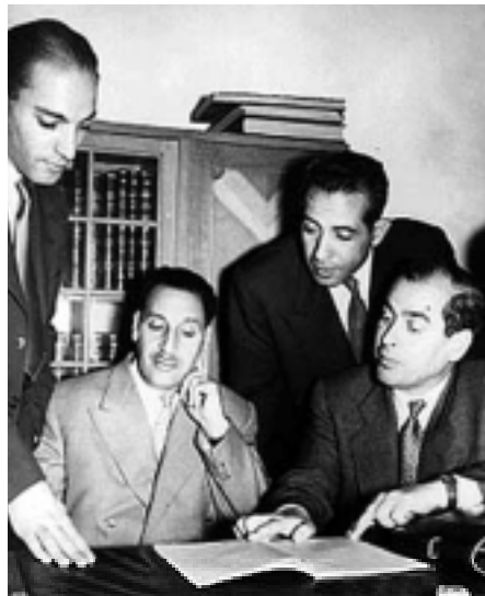
De algeriske revolutionsledere med det forbillige motto: "Algeriet for algeriere".

Der blev begået mange grusomheder af begge parter i konflikten, men det var som andre steder karakteristisk, at det kun var fra den franske opinion, at der lød kritik af egne udskjelser i felten, som så blev søgt korrigeret. Alligevel blev det bagefter franskmændene, som frem til i dag har måttet høre for deres grusomhed – ligesom Vesten, der som de eneste på eget initiativ har afskaffet slaveriet, stadig må høre for slavehandlen – osv.