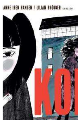
(/boeger/kom-0) KOM (/BOEGER/KOM-0) Af Marianne Iben Hansen