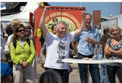
Uffe Elbæk på Folkemødet i 2012.

Det er aktivistiske projekter som akrobatikgruppen De Flyvende Pisbønner, ungdomsfestivalen Den Rullende Rottefestival, der ledte hen til kulturorganisationen Frontløberne, Next Stop Sovjet-projektet samt ikke mindst KaosPiloterne, hvor han var direktør for i 15 år. De kaospiloter, der var en torn i øjet på Dansk Folkeparti, men hvor af mange skabte levedygtige virksomheder.