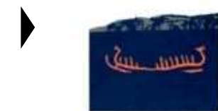
RESSOURCER OG KULTURKONTAKTER

( http://www.historie-online.dk/boger/anmeldelser-5-5/historie-og-topografi-11-11-11/egtvedpigens-rejse ) ( http://www.historie-online.dk/boger/anmeldelser-5-5/forhistorisk-tid-12-12/ressourcer-og-kulturkontakter )