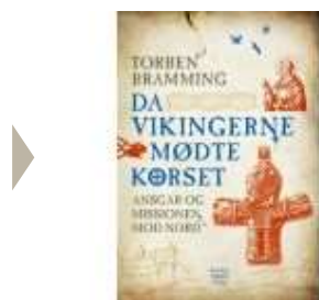
DA VIKINGERNE MØDTE KORSET

( http://www.historie-online.dk/boger/da-vikingerne-moedte-korset )