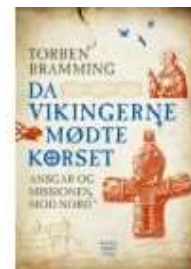
DA VIKINGERNE MØDTE KORSET

( http://www.historie-online.dk/boger/anmeldelser-5-5/vikingetid-og-middelalder-13-13-13-13/bjoernkaer-voldsted )