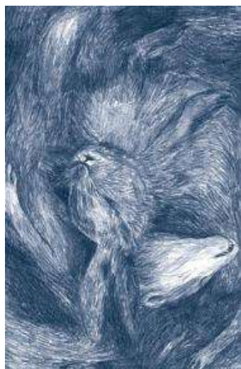
(/boeger/9-piger-hesten) 9 PIGER - HESTEN (/BOEGER/9-PIGER-HESTEN) Af Rikke Villadsen og Bjørn Rasmussen