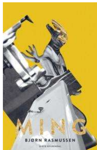
(/boeger/ming) MING (/BOEGER/MING) Af Bjørn Rasmussen