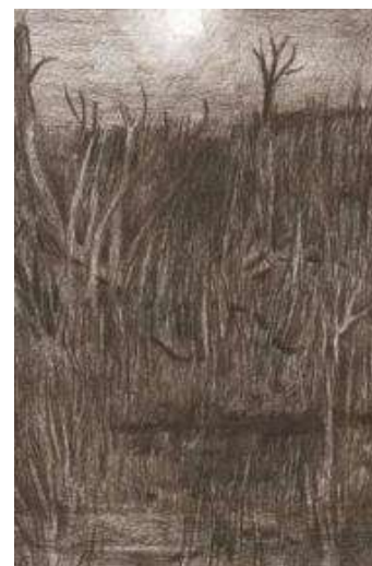
(/boeger/liftet) LIFTET (/BOEGER/LIFTET) Af Bjørn Rasmussen