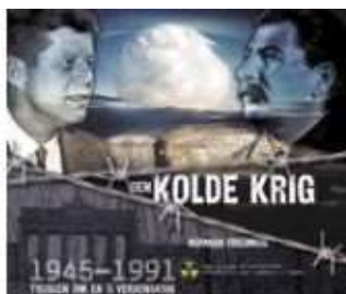
DEN KOLDE KRIG 1945-91

( http://www.historie-online.dk/boger/anmeldelser-5-5/danmark-og-europa-efter-1945/den-kolde-krig-1945-91 )