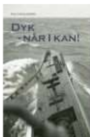
DYK - NÅR I KAN

( http://www.historie-online.dk/boger/anmeldelser-5-5/krig-og-terror-militaervaesen-vaben-den-kolde-krig/dyk-naar-i-kan )