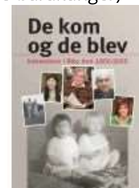
DE KOM OG DE BLEV

( http://www.historie-online.dk/boger/anmeldelser-5-5/lokal-og-slaegtshistorie/de-kaldte-os-barakunger )