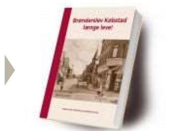
BRØNDERSLEV KØBSTAD LÆNGE LEVE

( http://www.historie-online.dk/boger/bronderslev-koebstad-laenge-lev )