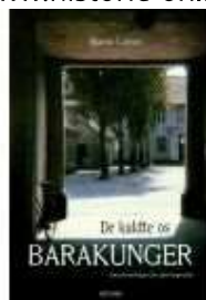
DE KALDTE OS BARAKUNGER

( http://www.historie-online.dk/boger/bronderslev-koebstad-laenge-lev )