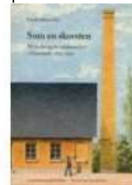
SOM EN SKORSTEN

( http://www.historie-online.dk/boger/anmeldelser-5-5/landbrug-haandvaerk-industri/guldsmede-og-guldsmedelaug-i-danmark-1429-1900 )