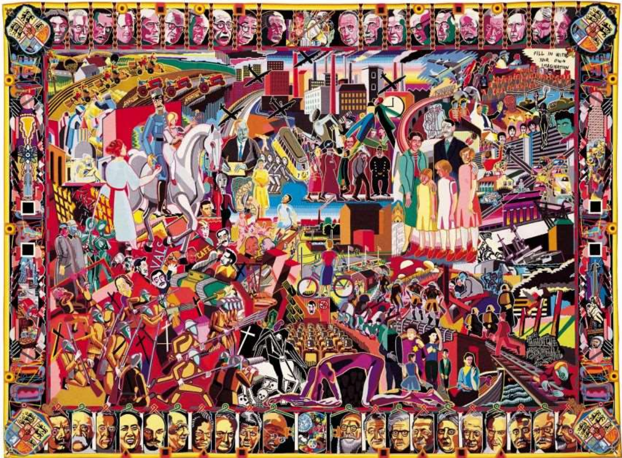
Bjørn Nørgaards gobelin med den nyere historie er også en fortælling.

Hertil kommer så 'farverne' på historien: "Endelig er det en fundamentalt spændende, inspirerende og foruroligende historie: med heltemod og forræderi, menneskelig storhed og fornedrelse – og meget af alt det midt imellem. Alt sammen at finde, hvor man venter det, men bestemt også tit, hvor man ikke venter det".(s.24).