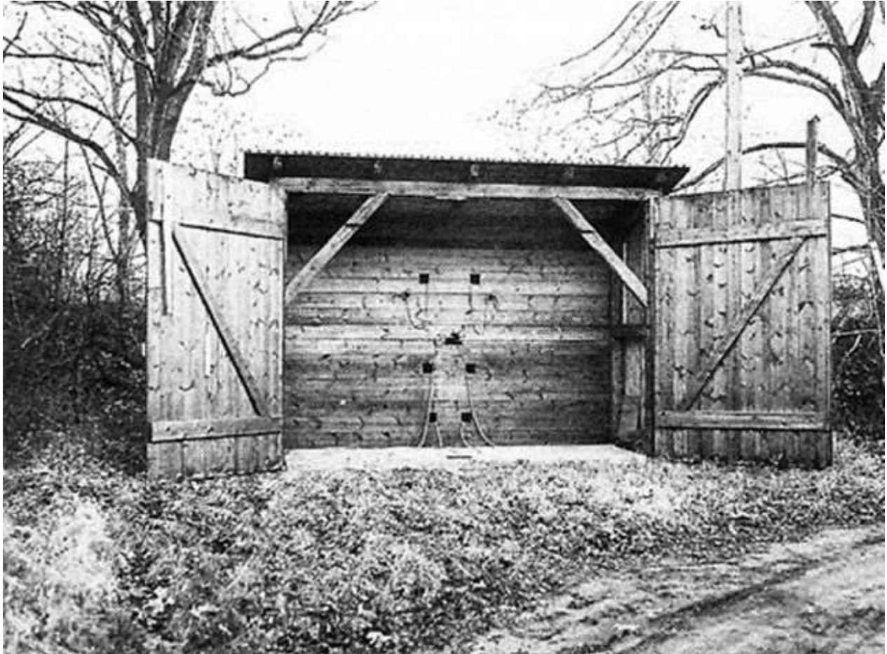
Henrettelsesstedet på Christiania. Tilbage er den cementerede del med risten.

nu retsopgøret. Det er ikke nogen helt let opgave at vælge ud, hvad der skal med. Men valgene er fine. Læsere, der måske for første gang skal beskæftige sig med emnet, er godt hjulpe. Forfatterne får ristet de indre modsætninger op og ligeledes problematikken omkring henrettelserne.