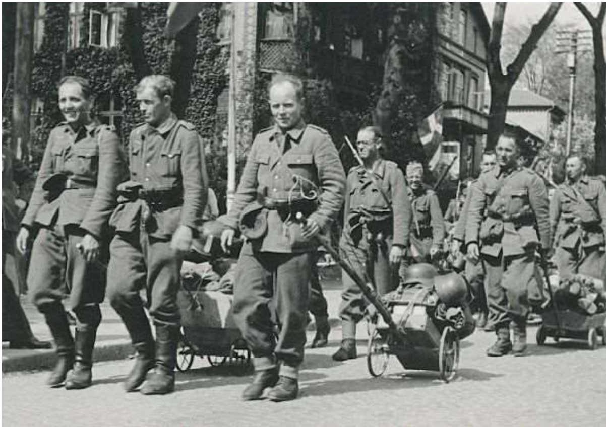
Maj 1945 Aabenraa, Frihedsmuseet. Sådan skifter billedet såmænd

Det er umuligt at kommentere samtlige kapitler i bogen. Men der er et generelt træk ved dem alle: de giver et fremragende blik ind i de historiske begivenheder, og de hviler i særdeleshed på stor faglig indsigt samt et næsten fælles sprog. Det sidste er lidt af en præstation, når der er tale om fire selvstændige historikere. En af de bidragsydende forekommer at være glad for lange sætninger. Hele 10 linjer før vi kommer til punktum. Det er ganske imponerende.