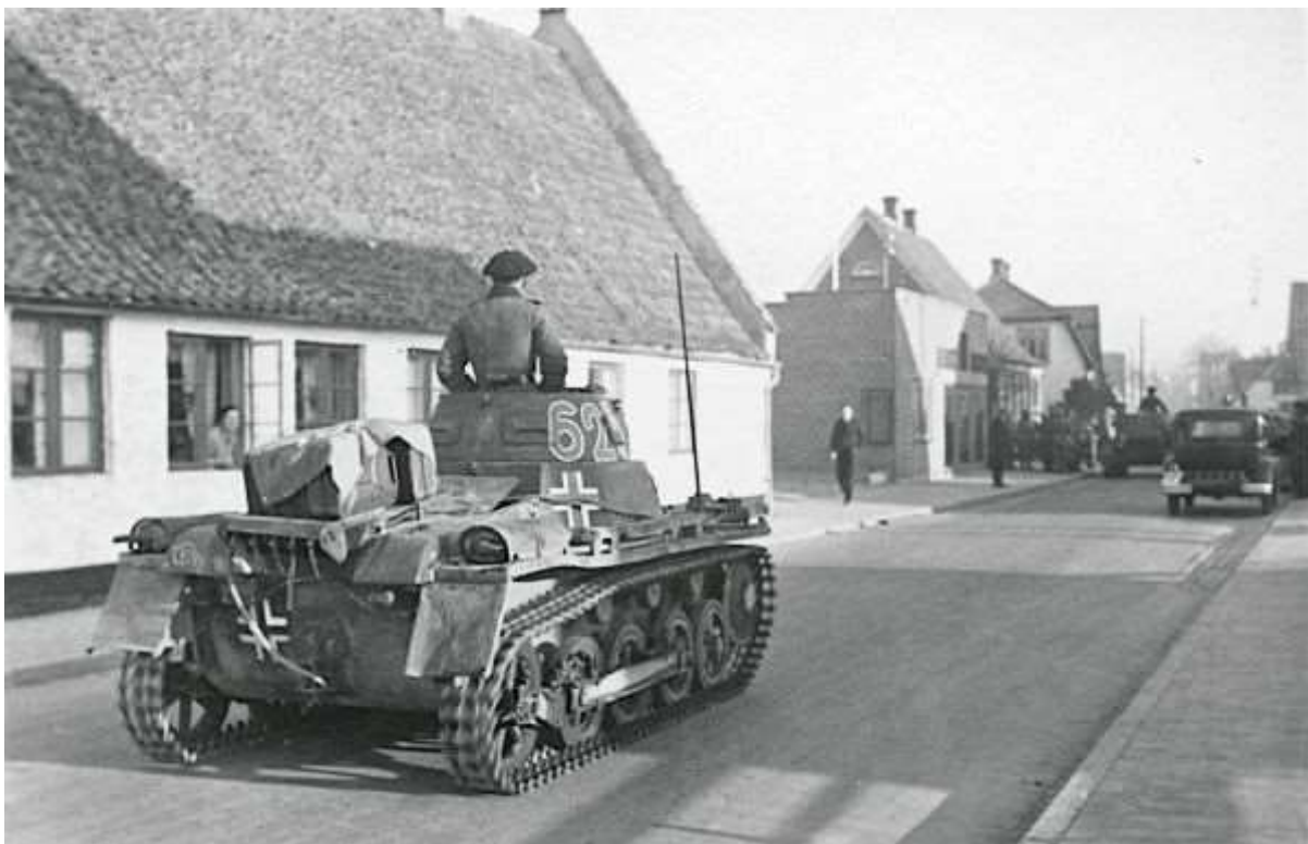
9. april 1940 i Aabenraa.

Del I er et fornemt eksempel på forfatterens målsætning. I den kontekst der knytter 1864, besættelsen og 1949 med NATO sammen. Man kan også – sådan lidt effektsøgende – sammenligne det med de koncentriske ringe, der opstår, når man smider en sten i vandet. Eller mere præcist med den såkaldte 'butterfly effect'. Det er faktisk særdeles fint arbejde.