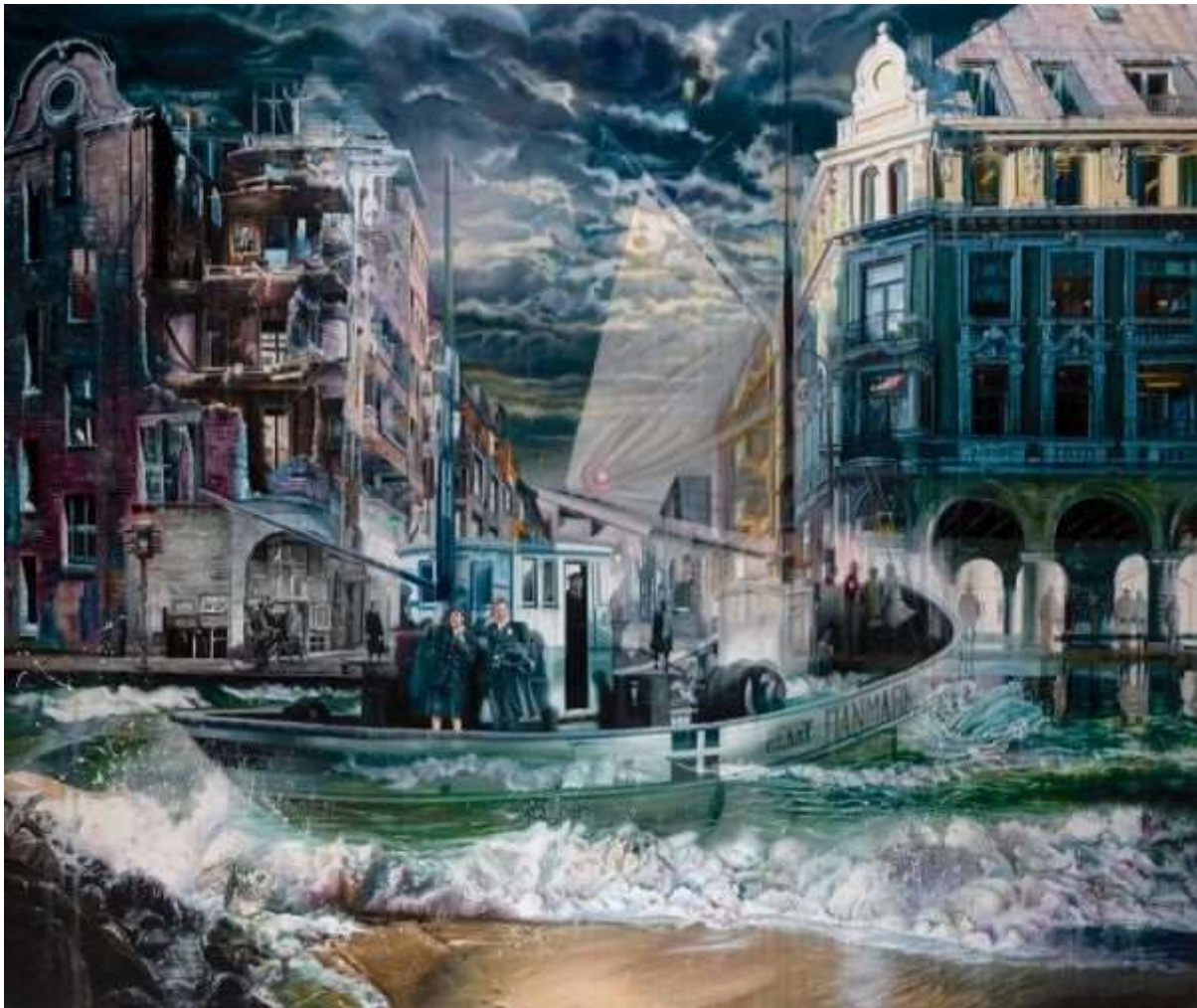
Den nye socialdemokratiske fortælling i gruppeværrelset på Christiansborg.