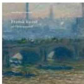
FRANSK KUNST PÅ ORDRUPGAARD

( http://www.historie-online.dk/boger/anmeldelser-5-5/kunst-arkitektur-haver-design-mode/fransk-kunst-paa-ordrupgaard )