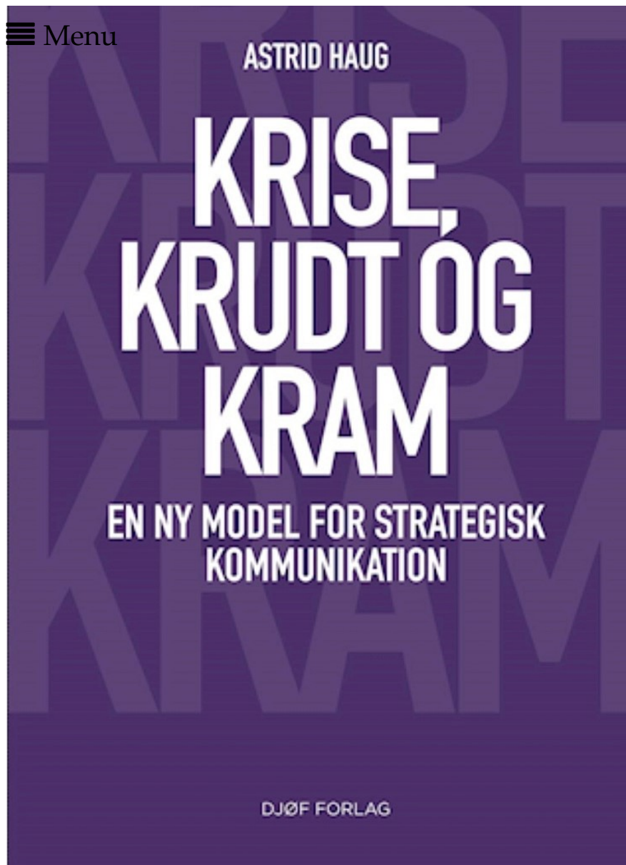
ASTRID HAUG: KRISE, KRUDT OG KRAM – EN NY MODEL FOR STRATEGISK KOMMUNIKATION. BOGENS FORSIDE.

Hver case har gjort noget anderledes, noget konsekvent og noget, der passer til de nye kommunikationsmønstre.