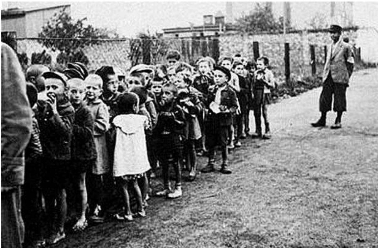
Et af bogens mange, valgte billeder viser en ganske almindelig samling børn, der står i kø og venter. Det rystende og martrende ved billedet er, at de intet kender til den skæbne, der venter dem.