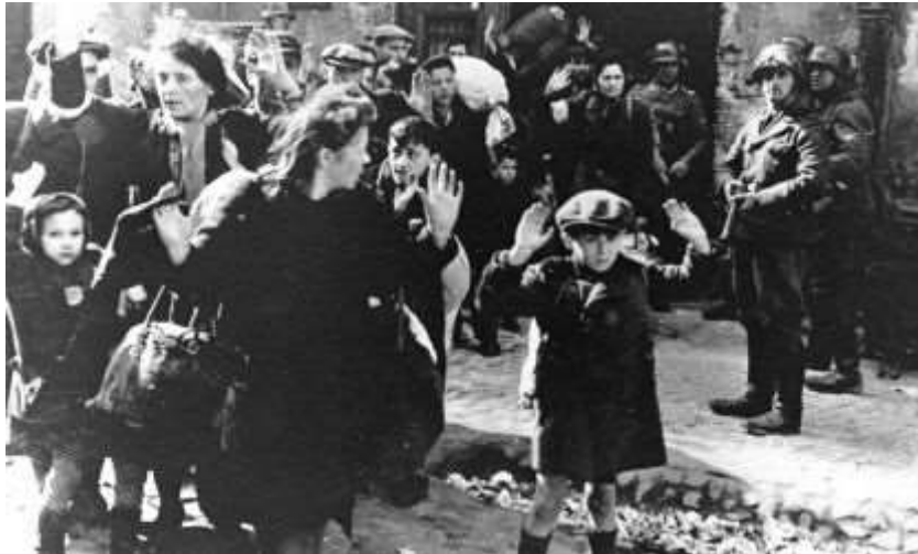
Warszawas ghetto 1943 med den lille dreng

Der er så megen historie med dette velkendte billede fra ghettoen i Warszawas ghetto. Her er det den lille dreng, det drejer sig om. Der gik rygter om, at han havde overlevet på mystisk vis. Det fik mig til at kontakte Simon Wiesenthal, da han var i Danmark. Jeg arbejdede på dette tidspunkt som redaktør i folketinget. Jeg ringede og spurgte efter ham. Han rejste sig fra middagen og kom til telefonen. Han havde data parat med det samme: den lille dreng var død i koncentrationslejr – det andet var pure opspind. Og så nævnte han i øvrigt soldaten ved navn og fortalte, at han var blevet henrettet i DDR.