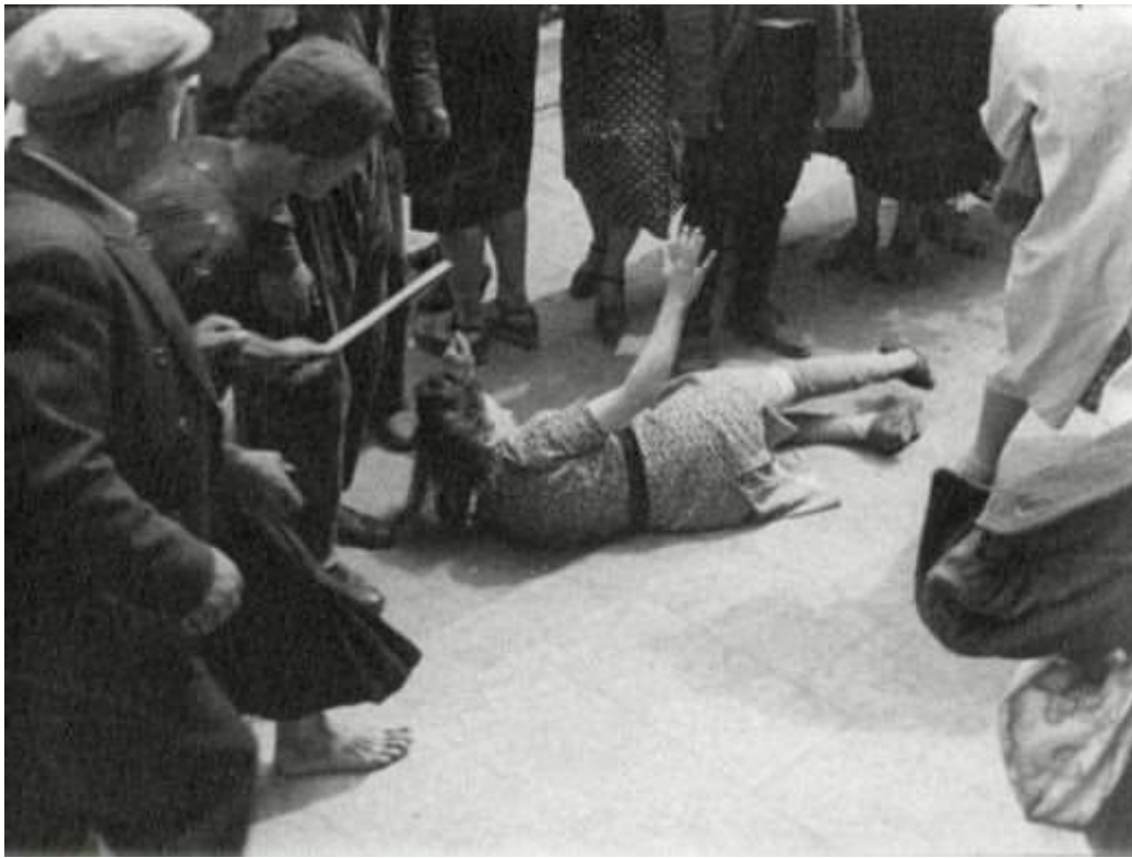
En jødisk kvinde er kastet til jorden og ligger omgivet af sine bødler. Illustration fra bogen.

I Litauen, Letland og Polen led jøderne samme skæbne.