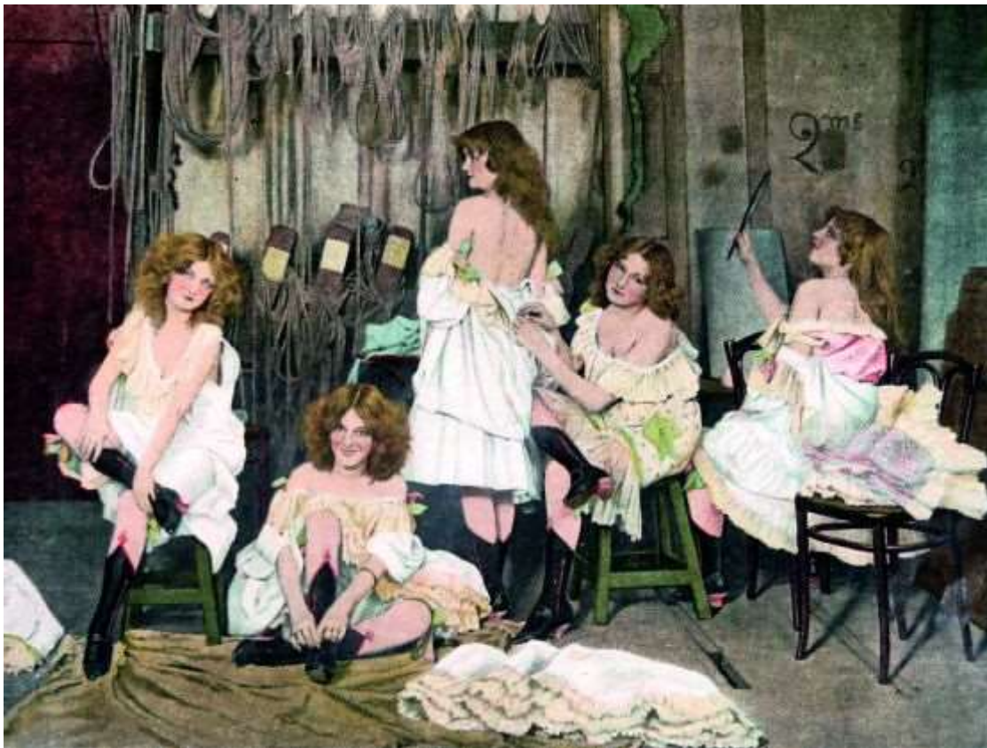
Barrison-søstrene var gode til at lave pikante opstillinger. Her fra omklædningsrummet på Folies Bergère.

Og det er samtidig en beskrivelse af fin de siècle-stemningen i de store byer, hvor borgerskabet stormede i varieteerne og opvartede danserinderne. Ligeledes en god beskrivelse af især Paris og Berlin i denne overgangsperiode, hvor der var kamp om moral og kultur. En kamp, der foregik mange steder, men ikke mindst accentueret i de to storbyer.