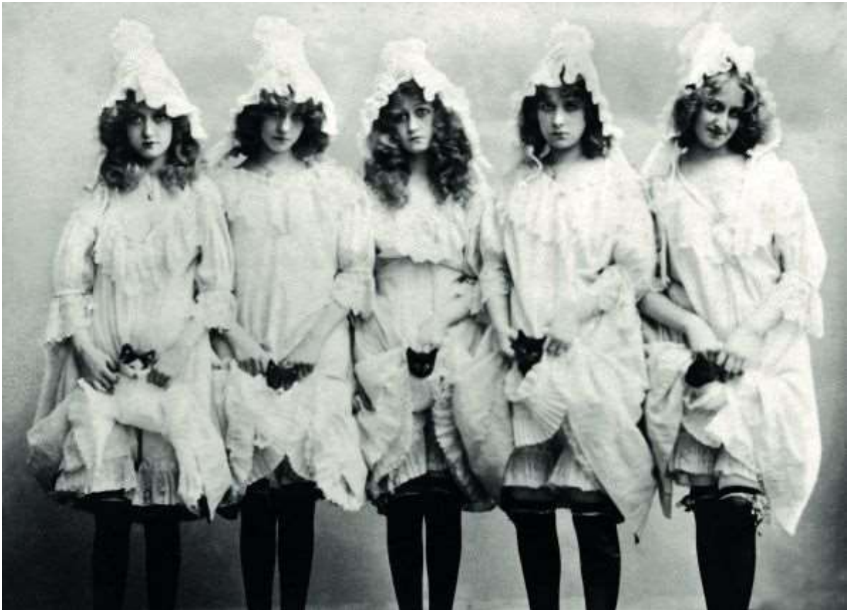
Fra nummeret med missekatten. Foto fra bogen.