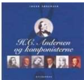
H.C. ANDERSEN OG KOMPONISTERNE

( http://www.historie-online.dk/boger/anmeldelser-5-5/musik-teater/hc-andersen-og-komponisterne )