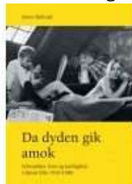
DA DYDEN GIK AMOK

( http://www.historie-online.dk/boger/anmeldelser-5-5/musik-teater/hc-andersen-og-komponisterne )