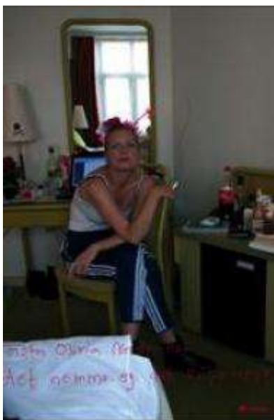
(/boeger/det-nemme-og-det-ensomme) DET NEMME OG DET ENSOMME (/BOEGER/DET-NEMME-OG-DET-ENSOMME)