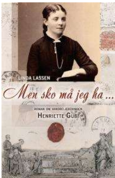
(/boeger/men-sko-ma-jeg-ha) MEN SKO MÅ JEG HÅ (/BOEGER/MEN-SKO-MA-JEG-HA) Af Linda Lassen (f. 1948)