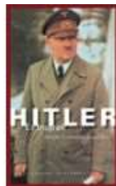
HITLER - EN BIOGRAFI

( http://www.historie-online.dk/boger/mandsmod-og-kongegunst )