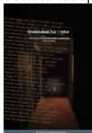
▶ ONDSKABEN TUR/RETUR

( http://www.historie-online.dk/boger/anmeldelser-5-5/besaettelsen/toldstrup-en-biografi-om-en-modstandshelt )