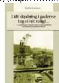
▶ LIDT SKYDNING I GADERNE TOG VI RET ROLIGT

( http://www.historie-online.dk/boger/anmeldelser-5-5/besaettelsen/ondskaben-tur/retur )