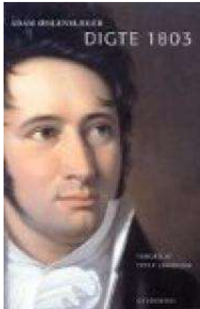
(/boeger/digte-1803-0) DIGTE 1803 (/BOEGER/DIGTE-1803-0) Af Adam Oehlenschläger