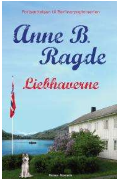
(/boeger/liebhaverne-0) LIEBHAVERNE (/BOEGER/LIEBHAVERNE-0) Af Anne B. Ragde