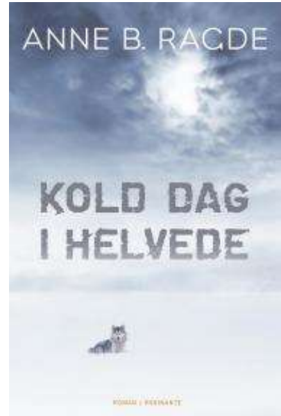
(/boeger/kold-dag-i-helvede) KOLD DAG I HELVEDE (/BOEGER/KOLD-DAG-I-HELVEDE) Af Anne B. Ragde