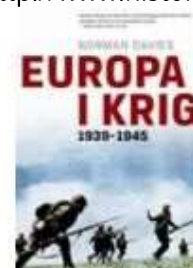
EUROPA I KRIG 1939 - 1945

( http://www.historie-online.dk/boger/2-verdenskrig-atlas )