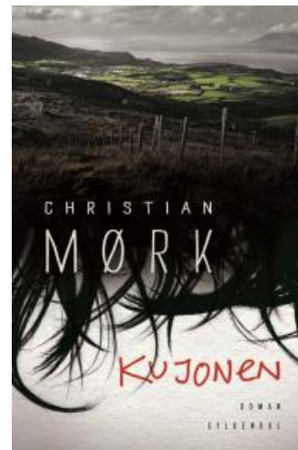
(/boeger/kujonen) KUJONEN (/BOEGER/KUJONEN) Af Christian Mørk