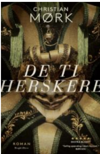
(/boeger/de-ti-herskere-0) DE TI HERSKERE (/BOEGER/DE-TI-HERSKERE-0) Af Christian Mørk