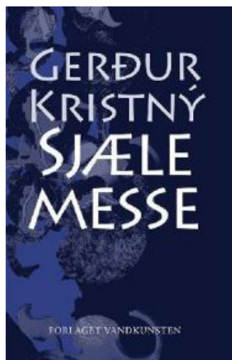
(/boeger/sjaelemesse) SJÆLEMESSE (/BOEGER/SJAELEMESSE) Af Gerður Kristný