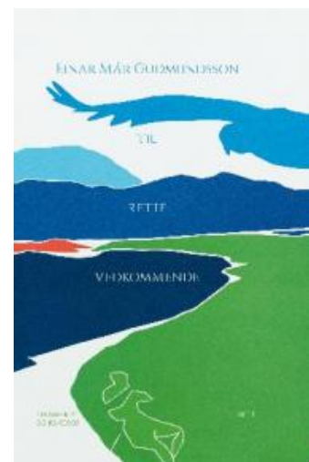
(/boeger/til-rette-vedkommende-digte) TIL RETTE VEDKOMMENDE (/BOEGER/TIL- RETTE-VEDKOMMENDE-DIGTE) Af Einar Már Guðmundsson