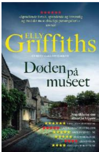
(/boeger/doden-pa-museet) DØDEN PÅ MUSEET (/BOEGER/DODEN-PA-MUSEET) Af Elly Griffiths