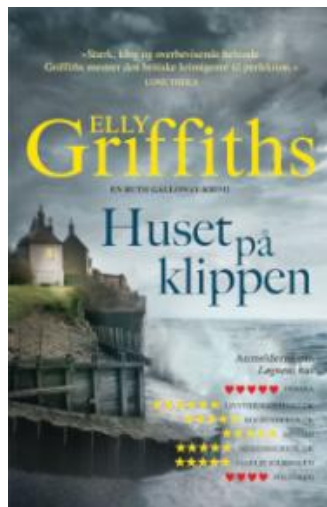
(/boeger/huset-pa-klippen) HUSET PÅ KLIPPEN (/BOEGER/HUSET-PA-KLIPPEN) Af Elly Griffiths