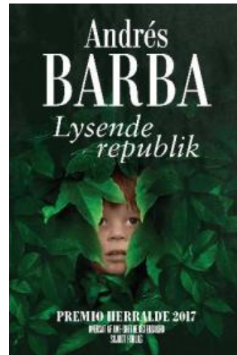
(/boeger/lysende-republik) LYSENDE REPUBLIK (/BOEGER/LYSENDE- REPUBLIK) Af Andrés Barba (f. 1975)