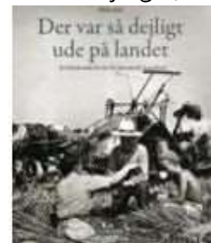
DER VAR SÅ DEJLIGT UDE PÅ LANDET

( http://www.historie-online.dk/boger/anmeldelser-5-5/natur-og-landskab/der-var-saa-dejligt-ude-paa-landet )