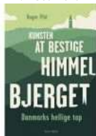
KUNSTEN AT BESTIGE HIMMELBJERGET

( http://www.historie-online.dk/boger/gribskov ) ( http://www.historie-online.dk/boger/anmeldelser-5-5/natur-og-landskab/kunsten-at-bestige-himmelbjerget )