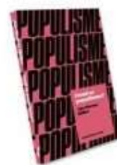
HVAD ER POPULISME?

( http://www.historie-online.dk/boger/bjergbestigning-i-alperne )