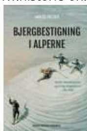
BJERGBESTIGNING I ALPERNE

( http://www.historie-online.dk/boger/the-league-of-nations )