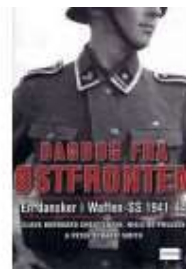
DAGBOG FRA ØSTFRONTEN

( http://www.historie-online.dk/boger/anmeldelser-5-5/biografier-erindringer-60-60/gerhard-von-kamptz-bornholms-sidste-kommandant )