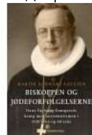
BISKOPPEN OG JØDEFORFØLGELSERNE

( http://www.historie-online.dk/boger/anmeldelser-5-5/kirke-og-religion/danmarks-doede-kirker )