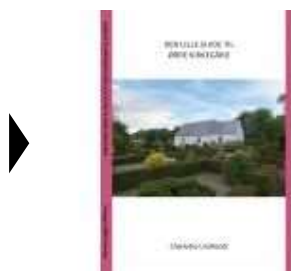
SMÅ GUIDER TIL ØRRE OG STUDSGAARD KIRKEGÅRDE

( http://www.historie-online.dk/boger/anmeldelser-5-5/kirke-og-religion/smaa-guider-til-oerre-og-studsgaard-kirkegaarde )