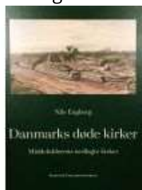
DANMARKS DØDE KIRKER

( http://www.historie-online.dk/boger/anmeldelser-5-5/kirke-og-religion/smaa-guider-til-oerre-og-studsgaard-kirkegaarde )