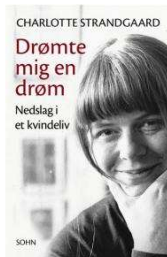
(/boeger/dromte-mig-en-drom-0) DRØMTE MIG EN DRØM (/BOEGER/DRØMTE-MIG-EN-DRØM-0) Af Charlotte Strandgaard