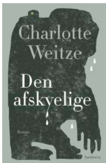
(/boeger/den-afskyelige) DEN AFSKYELIGE (/BOEGER/DEN-AFSKYELIGE) Af Charlotte Weitze