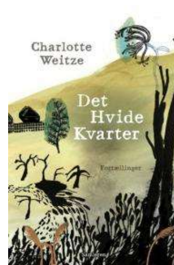
(/boeger/det-hvide-kvarter) DET HVIDE KVARTER (/BOEGER/DET-HVIDE-KVARTER) Af Charlotte Weitze