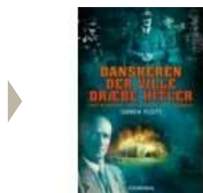
DANSKEREN DER VILLE DRÆBE HITLER

( http://www.historie-online.dk/boger/danskeren-der-ville-draebehitler-953 )