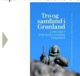
TRO OG SAMFUND I GRØNLAND

( http://www.historie-online.dk/boger/anmeldelser-5-5/kirke-og-religion/asmild-kirke-og-kloster )