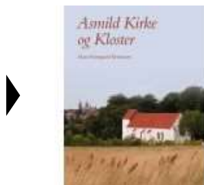
ASMILD KIRKE OG KLOSTER

( http://www.historie-online.dk/boger/anmeldelser-5-5/kirke-og-religion/asmild-kirke-og-kloster )