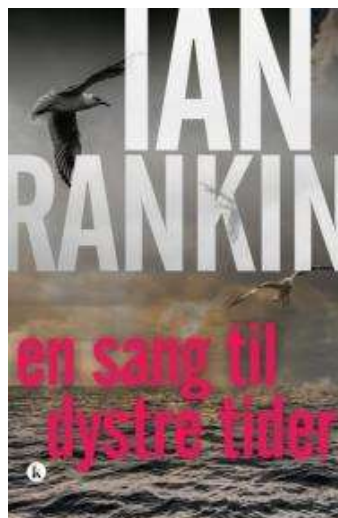
(/boeger/en-sang-til-dystre-tider) EN SANG TIL DYSTRE TIDER (/BOEGER/EN-SANG-TIL-DYSTRE-TIDER) Af Ian Rankin