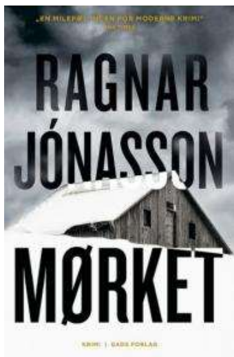
(/boeger/moerket-krimi) MØRKET (/BOEGER/MOERKET-KRIMI) Af Ragnar Jónasson (f. 1976)