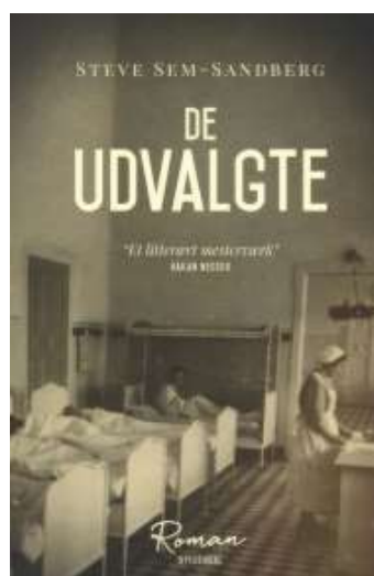
(/boeger/de-udvalgte-1) DE UDVALGTE (/BOEGER/DE-UDVALGTE-1) Af Steve Sem-Sandberg