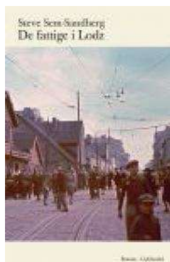
(/boeger/de-fattige-i-lodz) DE FATTIGE I LODZ (/BOEGER/DE-FATTIGE-I-LODZ) Af Steve Sem-Sandberg