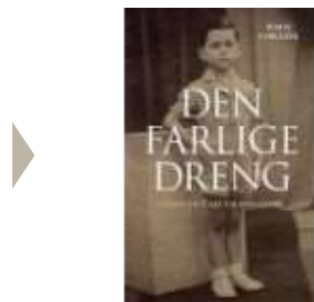
DEN FÆRLIGE DRENG

( http://www.historie-online.dk/boger/den-farlige-dreng )