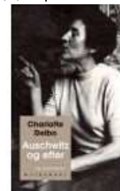
AUSCHWITZ OG EFTER

( http://www.historie-online.dk/boger/anmeldelser-5-5/nyt-billedvaerk-om-frivillige-i-waffen-ss )