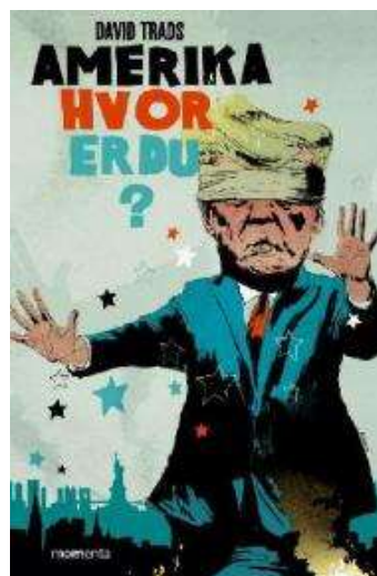
(/boeger/amerika-hvor-er-du) AMERIKA, HVOR ER DU? (/BOEGER/AMERIKA-HVOR-ER-DU) Af David Trads