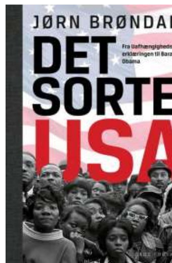
(/boeger/det-sorte-usa-fra- uafhaengighedserklaeringen-til-barack- obama) DET SORTE USA (/BOEGER/DET-SORTE-USA-FRA- UAFHAENGIGHEDSERKLAERINGEN-TIL-BARACK-OBAMA) Af Jørn Brøndal