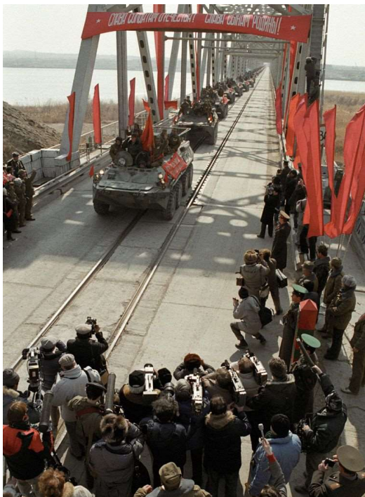
SOVJETTISKE TROPPER FORLADER

Men netop denne sag er et godt eksempel på, hvordan islamforskere ser forskelligt på tingene. En af Frankrigs store eksperter på feltet, Gilles Kepel, giver historien en anden vinkel i sin bog, Sortir du chaos , der netop er udkommet i engelsk oversættelse (Columbia University Press). Ifølge Kepel forholder det sig nemlig sådan, at Sovjetunionen den 15. februar 1989 erklærede, at man ville trække tropperne ud af Afghanistan, og dette havde den iranske efterretningstjeneste opsnappet på forhånd.