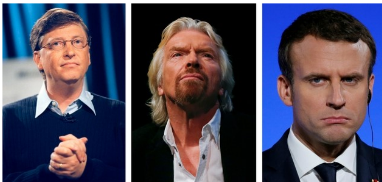
Bill Gates, Richard Branson og Emmanuel Makron: Verdens liberale Avenger-team, ifølge dem selv.