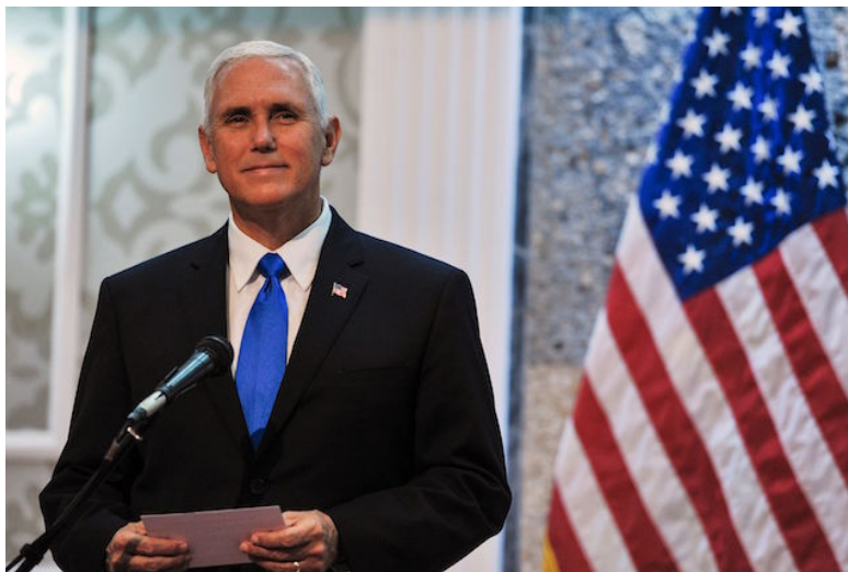
Vicepræsident Mike Pence.

Mike Pence er med sin mere libertære og endnu mere frimarkedsfundamentalistiske tilgang egentlig den foretrukne kandidat for mange af de store donorer bag Trump-administrationen som bl.a. Koch-brødrene.