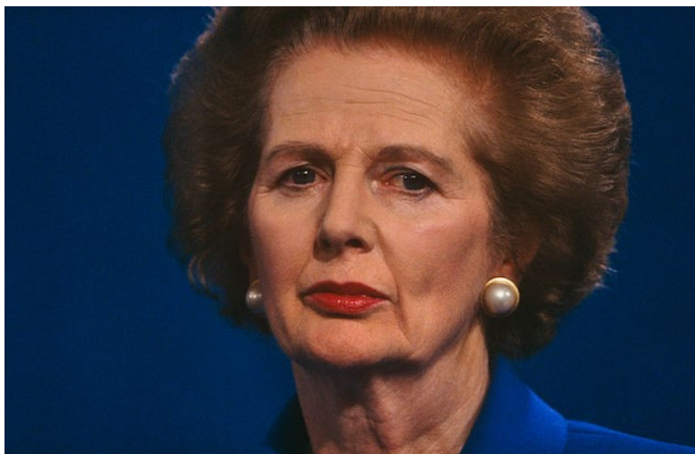
Margaret Thatcher, Englands tidligere premierminister, som også gik under navnet The Iron Lady og TINA (There Is No Alternative).

Hvor gerne vores politikere end vil skabe en bedre verden med bæredygtighed og reel medbestemmelse, så er der intet, de kan gøre. 'Der er intet alternativ', som Margaret Thatcher formulerede det. 'Sådan er det bare', sagde Margrethe Vestager nogle år senere.