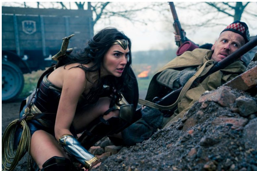
Wonder Woman bag fjendens linjer

er udtrykket i dette tilfælde så tilpas fortyndet igennem Jenkins' filter, at det bliver helt spiseligt. Og så skal Snyder-modellen trods alt have den ros, at man – også som en ikke længere helt ung biografgænger – faktisk kan afkode, hvad der sker i actionsekvenser.