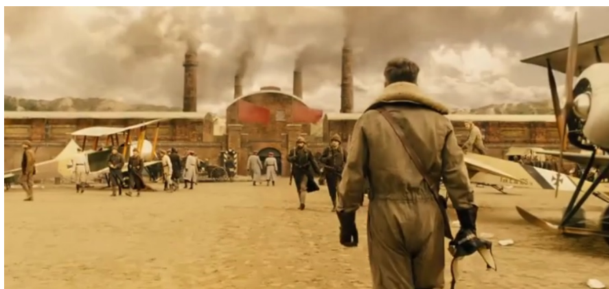
▶ Batman, Batman V Superman, Wonder Woman, Zack Snyder

Wonder Woman er ikke en perfekt film – langfra. Men bedømt på sin genre og sin hovedfigur, der ikke hører til de nemmeste at tilpasse filmmediet, så gør den det overraskende godt. Og den understreger samtidig, hvad flere andre film i genren ikke lykkes med – at identificere kernen i figuren og lade det primære plot udspringe direkte og i naturlig forlængelse heraf. Det er det solide fundament, men kan bygge rigtig meget op på, og hvis man har det, kan man også begå fejl hist og her, uden at det får hele konstruktionen til at brase sammen.