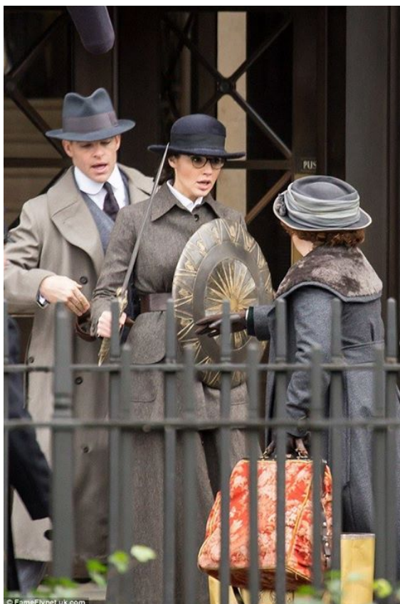
Steve, Diana og Steves sekretær

Filmen realiserer også det humoristiske potentiale i at lade os se vores verden gennem en fremmed og fantastisk skabnings øjne. Diana er vokset op i eventyrland; hun har aldrig set en (nøgen) mand før Steve, aldrig set en ur eller en bil eller en by, aldrig gået i kjole eller høje hæle osv. Det er ret nemt at trække nogen billige grin eller smil ud af, men det har virkelig været tiltrængt i især DC's filmunivers, som i modsætning til f.eks. Marvels Guardians of the Galaxy , Spiderman og Ant-Man har enten været håbløst humorforladt ( Superman ) eller fejlet fuldstændigt i et desperat forsøg på at være morsom ( Suicide Squad ).