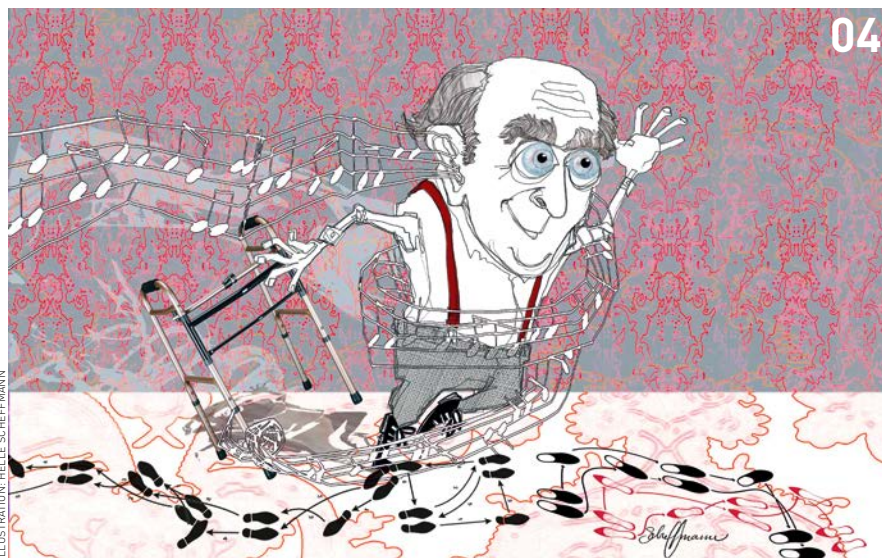
ILLUSTRATION: HELE SCHEFFMANN