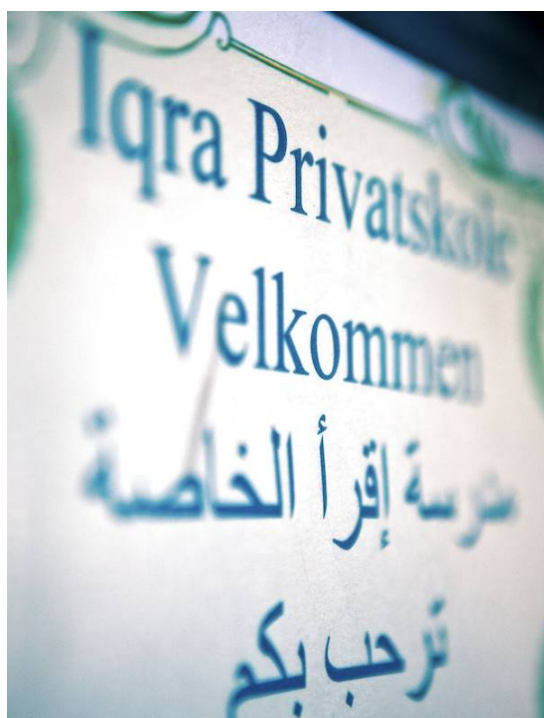
Privatskoler efter religiøse retninger findes allerede i Danmark. Her ses Iqra Privatskole på Nørrebro, København.

De private skoler er ikke "generelle" skoler, men specialiserede skoler. Sommetider efter pædagogiske principper – men langt oftere efter religiøse retninger. Det giver endnu mere splittelse i samfundet.