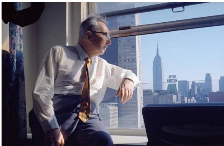
Viktor Frankl i New York, USA. Han blev befriet af amerikanske soldater i 1945.