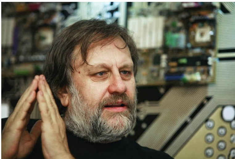
Den slovenske 'stjernefilosof' Slavoj Žižek.

Bogen udkom første gang i december 2015 i en tysk oversættelse, hvilket blev fulgt op af en engelsk udgave i foråret 2016 med et tilføjet kapitel om overgrebene nytårsnat i Köln, og der er således tale om en art langstrakt debatindlæg, hvis anledning er den såkaldte flygtningekrise og de offentlige debatter, den har givet anledning til.