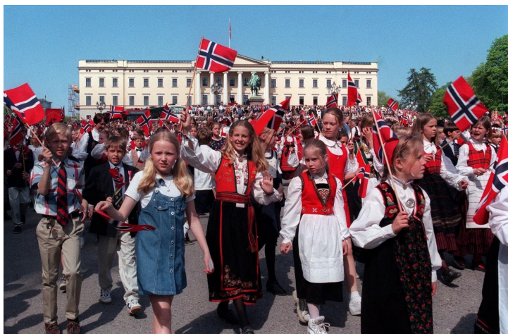
Norge - eller rettere idéen om Norge som harmonisk og grænseløs velfærdsstat - findes ifølge Žižek ikke.

Det er snarere en ubevidst forestilling eller fantasi om, hvordan verden hænger sammen, og som har virkelige konsekvenser, fordi vi altid handler i henhold til, hvordan vi forestiller os, verden hænger sammen. Vi lever aldrig i blot i verden, som den er, men altid i verden, som vi forestiller os den.