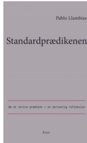
STANDARDPRÆDIKENEN – Om at skrive en prædiken – en personlig refleksion. Aros 2014

Synes godt om 9 personer synes godt om dette. Opret en profil for at se, hvad dine venner synes godt om.