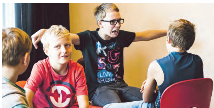
Lyveskolen, et læringsprojekt med folkeskolen ... 28