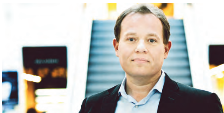
KBH: Nye værdier, kompetenceprofiler og drøm om nyt bibliotek ... 24