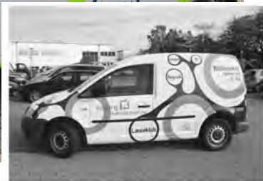
写真1.「図書館があなたのところに！」と描かれたワゴン車型端末。スマートフォンなどを積みこんでリクエストを受けた高齢者施設や学校を訪問する新たなアウトリーチサービスである。訪問先では機器の講習会やデジタル機器を使ったワークショップを