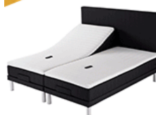
Ben og gavl købes separat